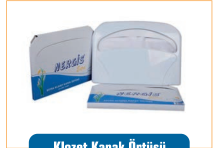
Klozet Kapak Örtüsü