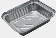
250 gr Kap