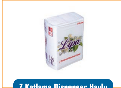
Z Katlama Dispenser Havlu