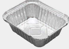
350 gr Kap