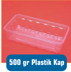
500 gr Plastik Kap