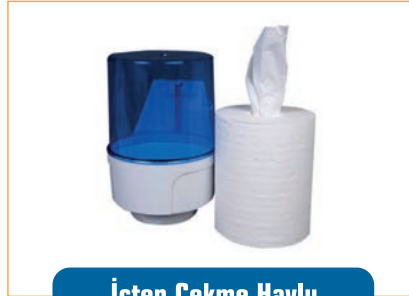
İçten Çekme Havlu