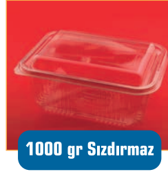
1000 gr Sızdırmaz