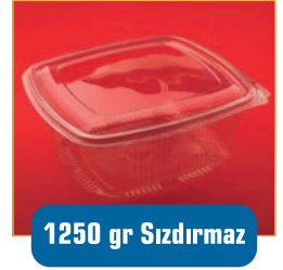
1250 gr Sızdırmaz