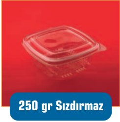
250 gr Sızdırmaz