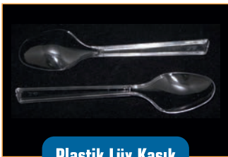
Plastik Lüks Kaşık