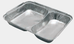
2 bölmeli Kap