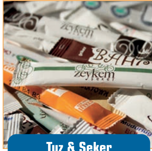
Tuz & Şeker