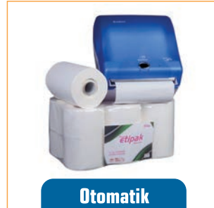
Otomatik Makine Rulosu