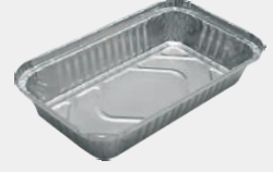
750 gr Kap