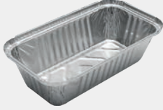
1000 gr Derin Kap