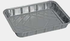
1500 gr Kap