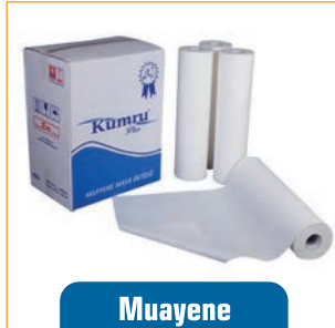
Muayene Masa Örtüsü