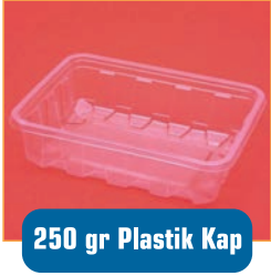
250 gr Plastik Kap