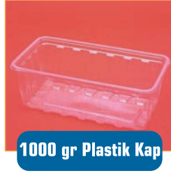
1000 gr Plastik Kap