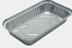
1000 gr Kap