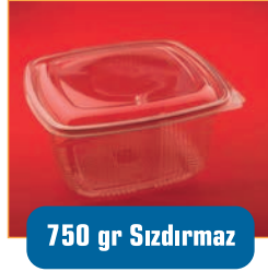
750 gr Sızdırmaz