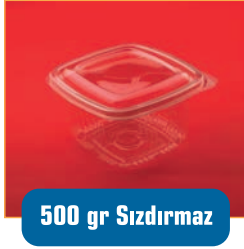
500 gr Sızdırmaz