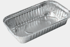
500 gr Kap