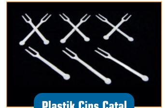
Plastik Cips Çatal