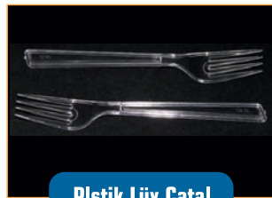
Plstik Lüks Çatal