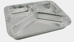
3 bölmeli Kap