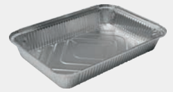
5000 gr Kap