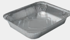
3250 gr Kap