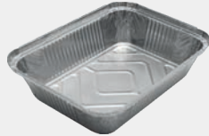
2500 gr Kap