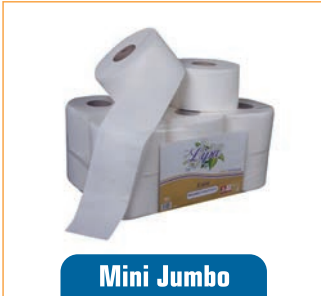
Mini Jumbo Tuvalet Kağıdı