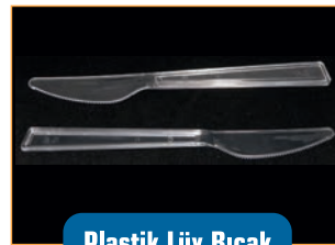
Plastik Lüks Bıçak